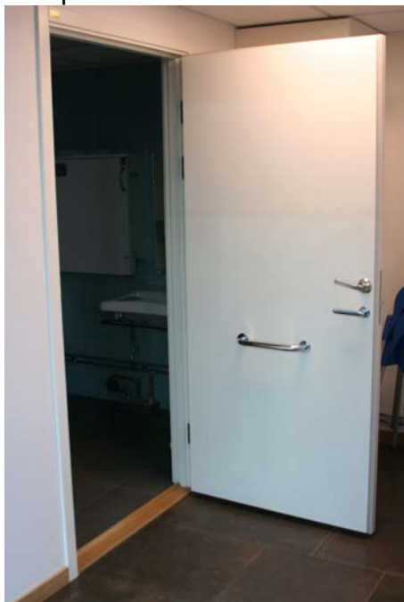
Bild på HCPToalett

Dörren är en utåtgående slagdörr med passagemåttet 84 cm och draghandtag