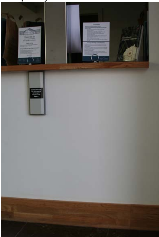
Bild på biljettkassan