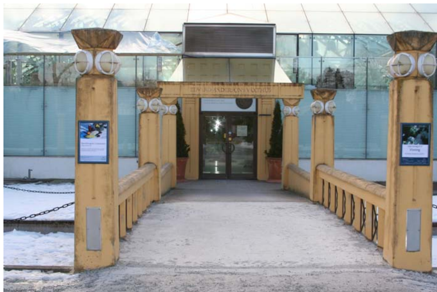
Bild på entrén

Entrédörren är en utåtgående slagdörr med sidodörr. Passagemåttet är 84 cm, med båda dörrarna öppna är det 1,68 meter.