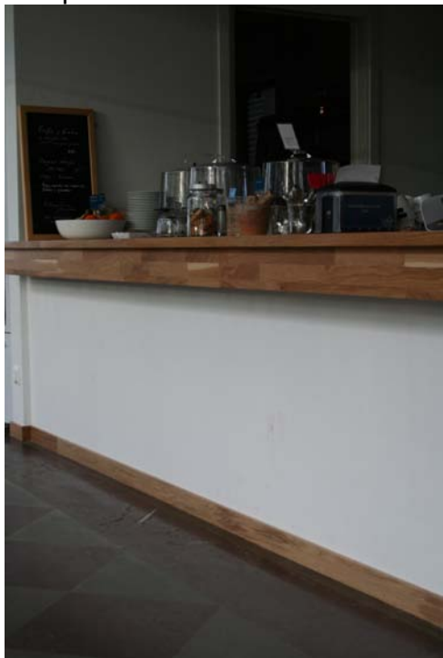
Bild på butikdelen