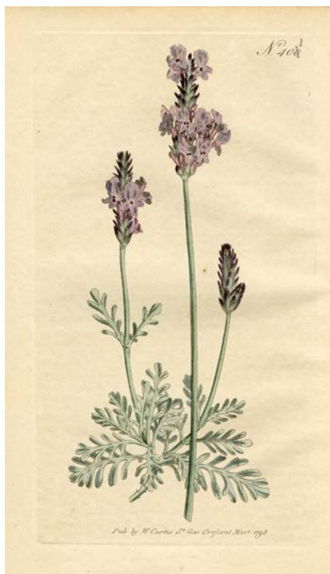
Fjäderlavendel Lavandula pinnata i Curtis Botanical Magazine 1798.

År 1780 skrev Linnés son, Carl von Linné den yngre, den första monografen om lavendelsläktet – De Lavandula . Han beskrev bland annat arten fjäderlavendel Lavandula pinnata som ny för vetenskapen, men hade själv inte sett den i naturen. År 1777 fördes arten från Madeira till London av den engelske trädgårdsmästaren Francis Masson. Två år senare passerade Linnélärjungen Carl Peter Thunberg London och tog med sig herbarie-exemplar av lavendeln till Linné den yngre i Uppsala.