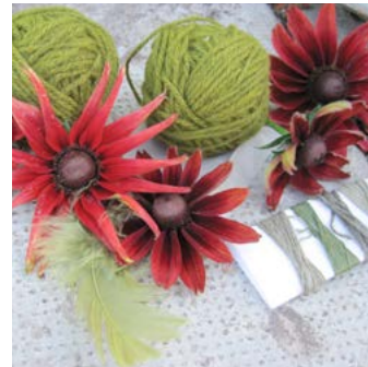
Sommarrudbeckia Rudbeckia hirta var. pulcherrima