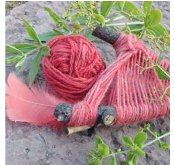
Krapp Rubia tinctorum