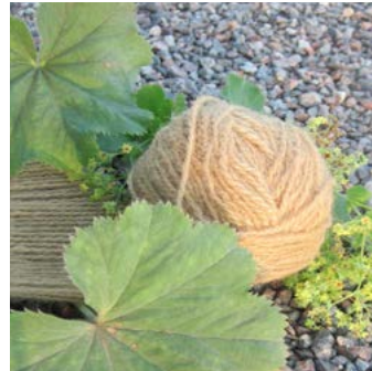
Jättedaggkäpa Alchemilla mollis