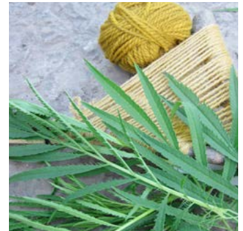
Stinktagetes Tagetes minuta