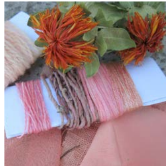
Safflor Carthamus tinctorius