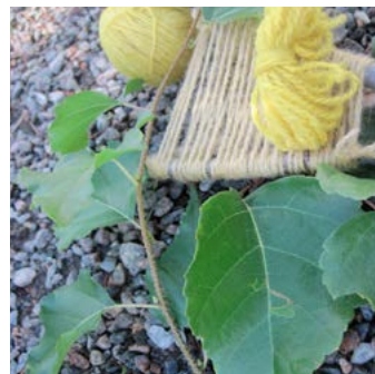
Vårtbjörk Betula pendula