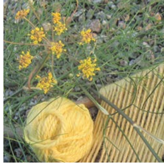
Bronsfänkål Foeniculum vulgare