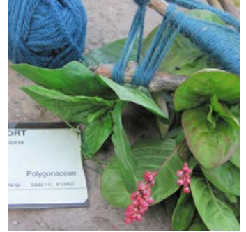
Färgpilört Persicaria tinctoria