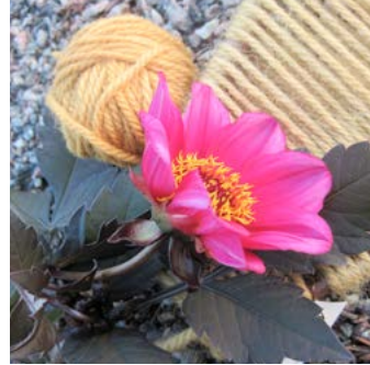
Dahlia Dahlia x pinnata