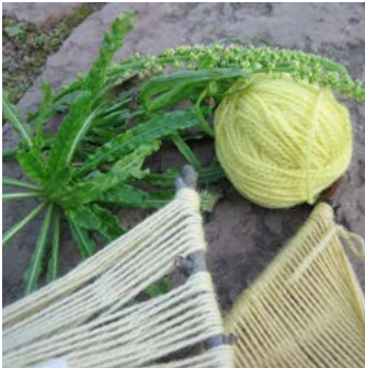
Färgreseda Reseda luteola