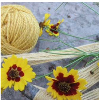
Tigeröga Coreopsis tinctoria