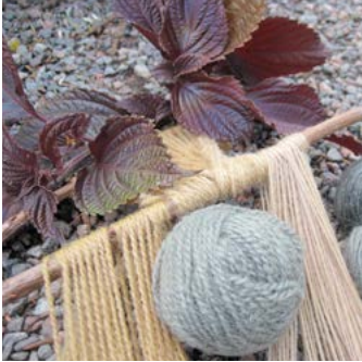
Bladmynta Perilla frutescens