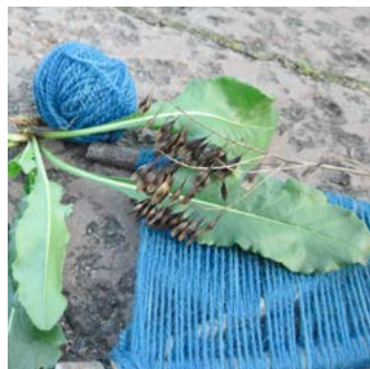
Vejde Isatis tinctoria