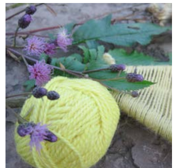
Ängsskära Serratula tinctoria