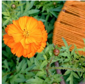
Gullskära Cosmos sulphureus