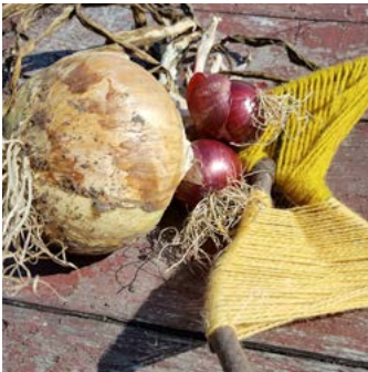
Lök Allium cepa