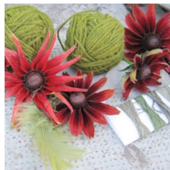
Sommarrudbeckia Rudbeckia hirta var. pulcherrima