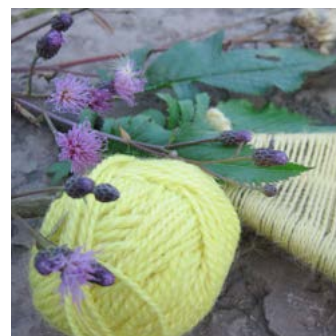
Ängsskära Serratula tinctoria