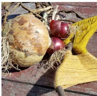
Lök Allium cepa