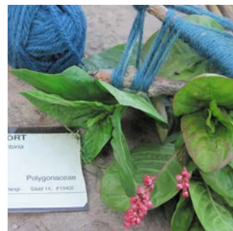
Färgpilört Persicaria tinctoria