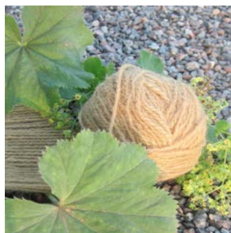
Jättedaggkåpa Alchemilla mollis