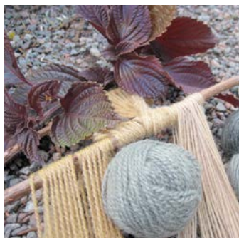
Bladmynta Perilla frutescens