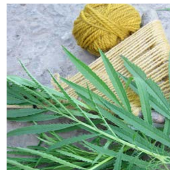
Stinktagetes Tagetes minuta