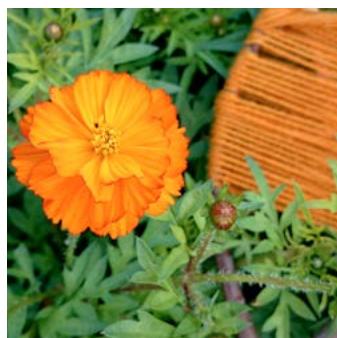
Gullskära Cosmos sulphureus