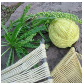
Färgreseda Reseda luteola