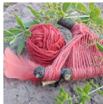
Krapp Rubia tinctorum