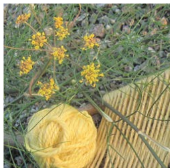
Bronsfänkål Foeniculum vulgare