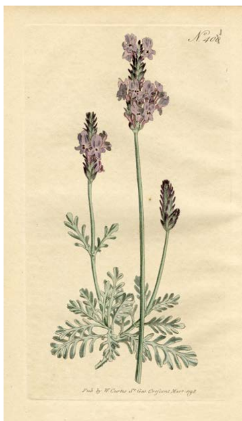
Fjäderlavendel Lavandula pinnata i Curtis Botanical Magazine 1798.

År 1780 skrev Linnés son, Carl von Linné den yngre, den första monografen om lavendelsläktet – De Lavandula . Han beskrev bland annat arten fjäderlavendel Lavandula pinnata som ny för vetenskapen, men hade själv inte sett den i naturen. År 1777 fördes arten från Madeira till London av den engelske trädgårdsmästaren Francis Masson. Två år senare passerade Linnélärjungen Carl Peter Thunberg London och tog med sig herbarie-exemplar av lavendeln till Linné den yngre i Uppsala.